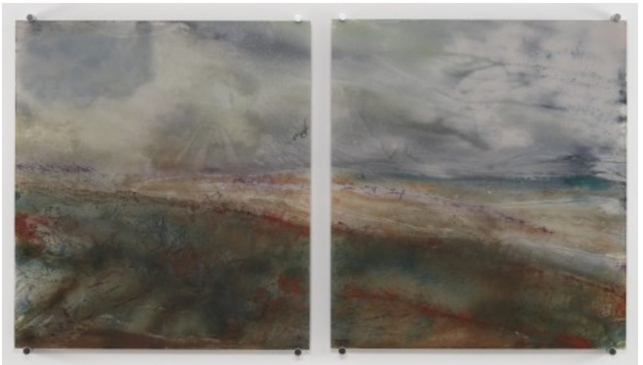
Giacinto Occhionero - November Hydrofool

Scritto da Redazione | domenica, 17 luglio 2011